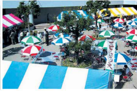
パイプテントカラー