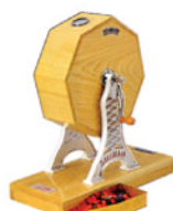
抽選器 Size:大・中・小 RE-1009