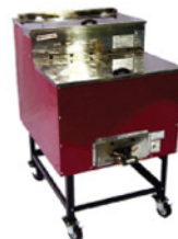
石焼きいも器 Size:W585xD710xH920 RE-1004