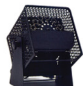
シャボン玉発生機 Size:W250xD230xH290 RE-1008