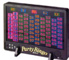
電子ビンゴゲーム Size:W770xH420 RE-1006 Size:W500xH300 RE-1007