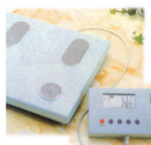
脂肪計付ヘルスマーター RE-1020