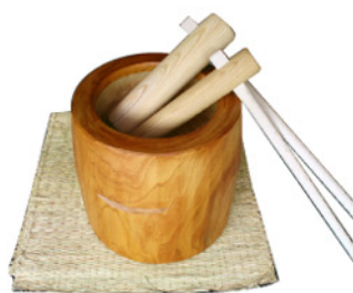
餅つきセット〔榎(けやき)臼〕 榎臼・むしろ・杵・セイロ・カマド RE-1024