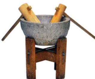
餅つきセット〔石臼〕 石臼・台・杵・セイロ・カマド RE-1022