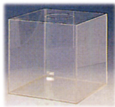
抽選ボックス(透明) Size:W300xD300xH300 RE-1012