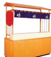
屋台 Size:W1800xD600xH2100 RE-2002