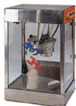
ポップコーン機 Size:W470xD400xH730 RE-1002