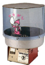
綿菓子機 Size:W640xD640xH830 RE-1003