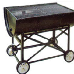
バーベキューセット Size:W900xD600xH700 RE-1005