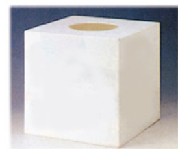
抽選ボックス(白) Size:W300xD300xH300 RE-1011